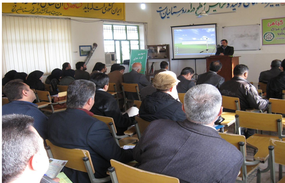
برگزاری دوره آموزشی ویژه کشاورزان (۱)