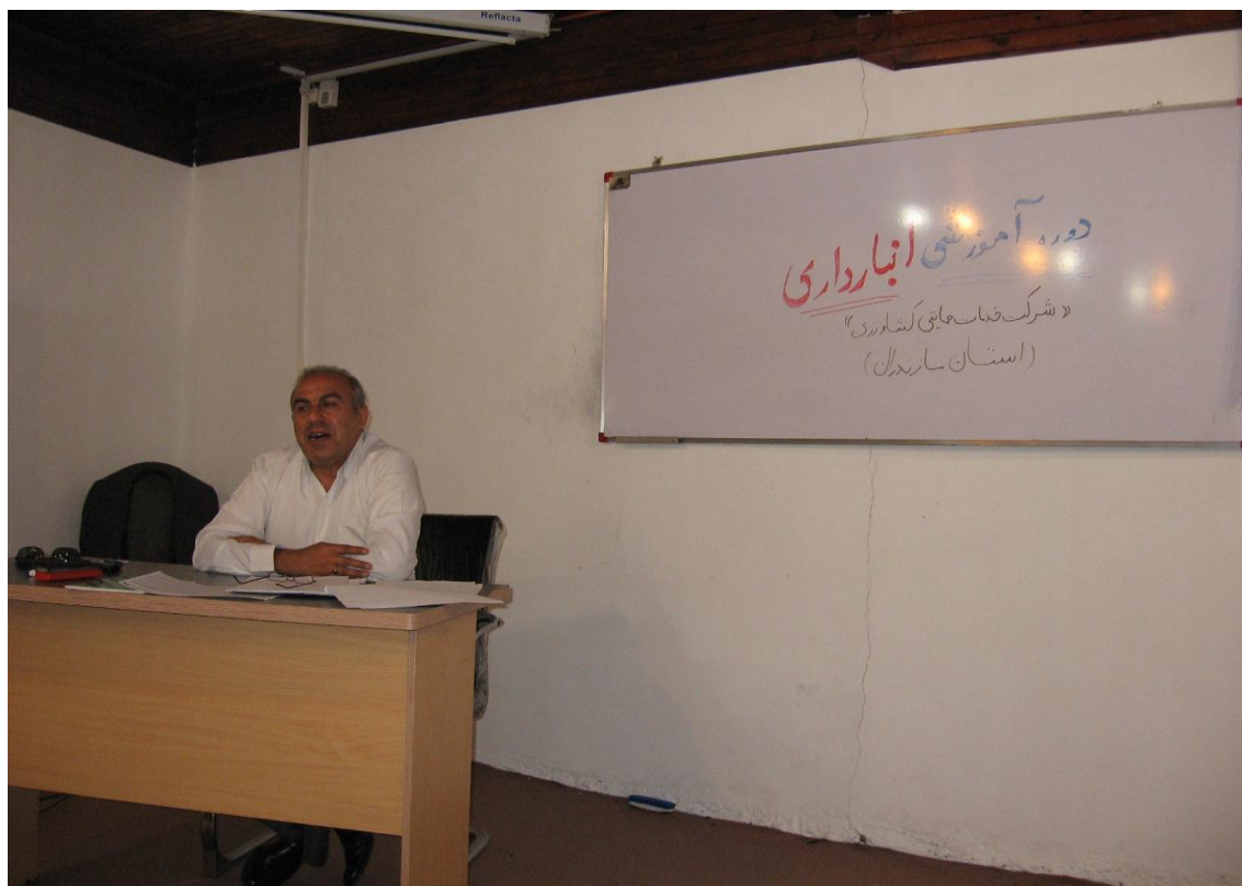
برگزاری دوره آموزشی ویژه کارکنان