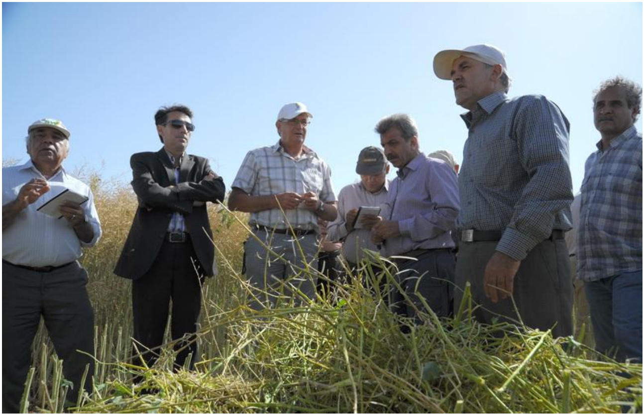
برگزاری دوره آموزشی ویژه کشاورزان (۲)