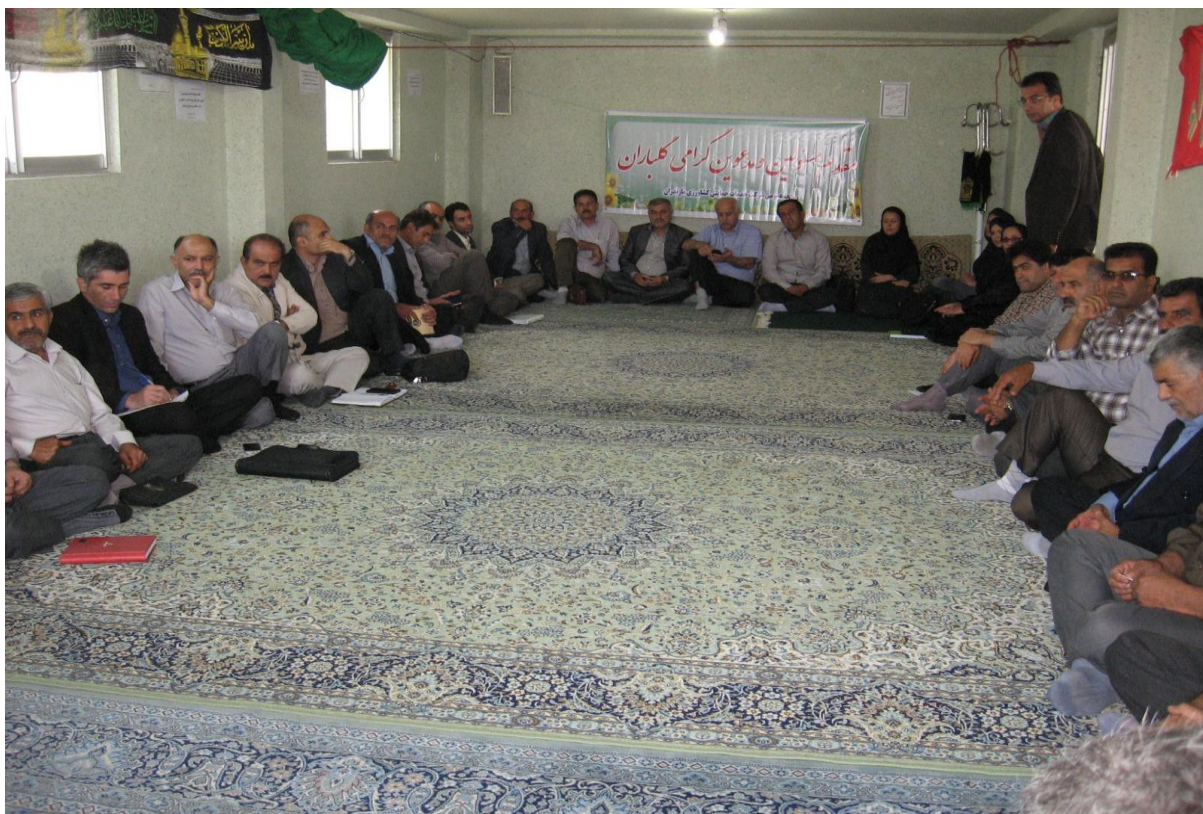
برگزاری دوره های آموزشی ویژه کارگزاران (۱)