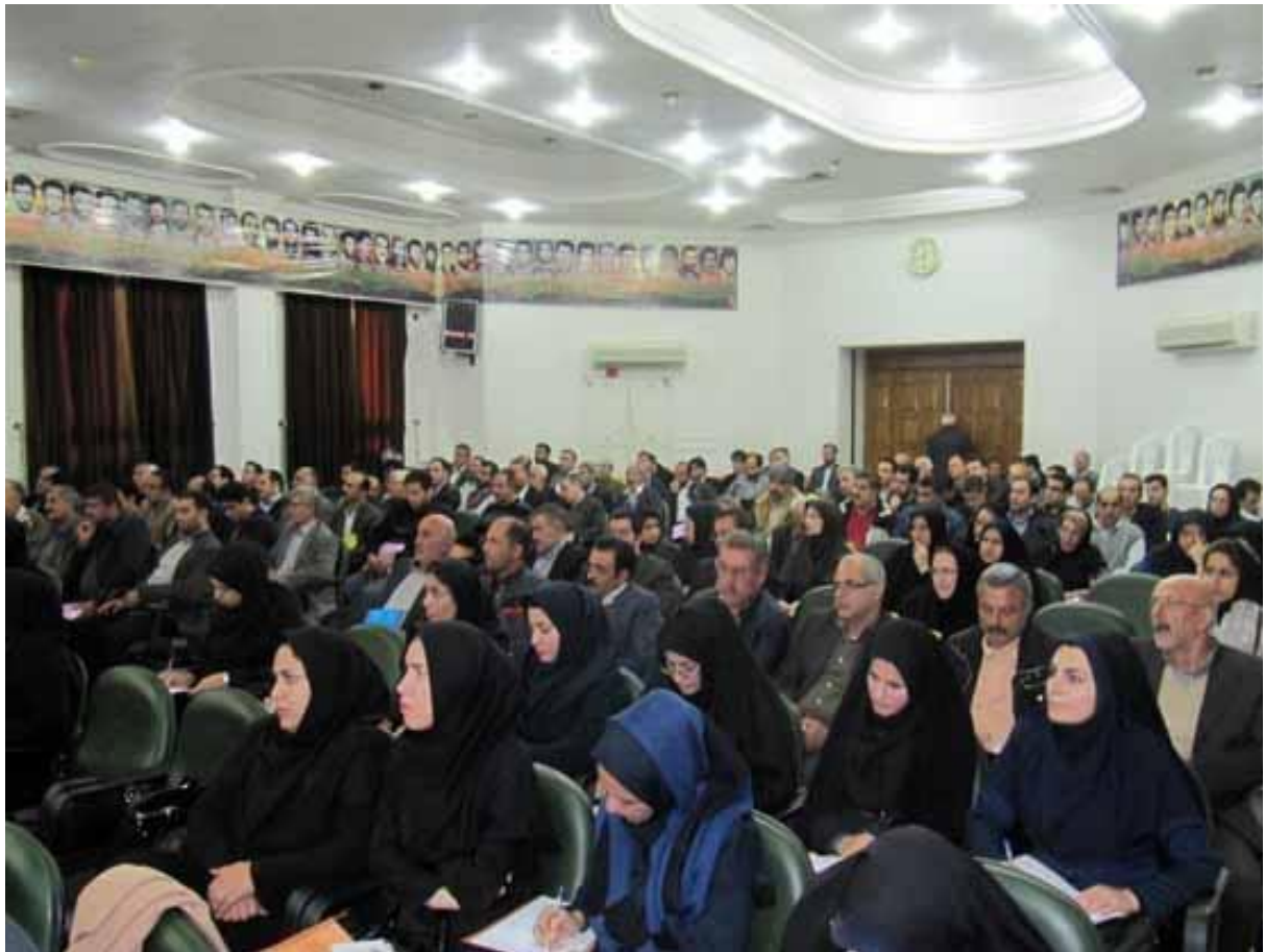
برگزاری دوره آموزشی ویژه کارگزاران (۲)