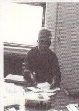
نیاز استان هم براساس نیاز کمیته بذر استان توسط شرکت خدمات حمایتی کشاورزی هر ساله تامین و توزیع می شود.

وی با اشاره به نقش کود در اصلاح و تقویت خاکهای زراعی و باغی خصوصاً کود شیمیایی کلرور پتاسیم به جهت دارا بودن عنصر کلر و به عنوان عامل کنترل بیماریهای ریشه و طوقه محصولات زراعی نظیر کلزا، گندم و جو و شلتوک برنج، ضمن اینکه عنصر پتاسیم از نیازهای اصلی و اساسی گیاهان زراعی و باغی می باشد افزود به جهت حساسیت این موضوع در حال حاضر کود کلرو پتاسیم با توجه به نیاز گسترده اراضی زراعی و باغی استان توسط شرکت خدمات حمایتی کشاورزی مازندران به میزان کافی تامین شده است. بنابراین از کشاورزان انتظار می رود با تهیه این کود بخشی از مشکلات در زمینه افزایش کمی و کیفی محصولات زراعی و باغی خود را با مصرف این کود حل نمایند