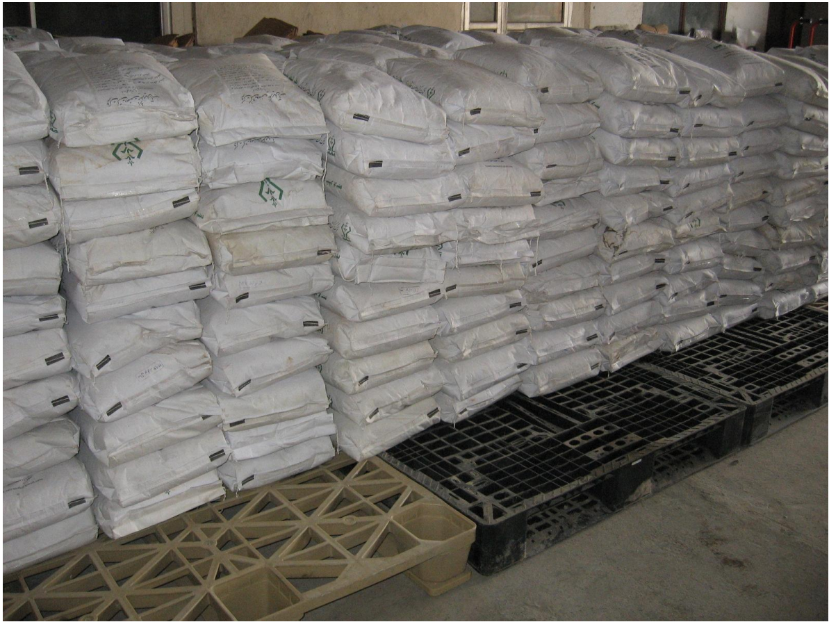
تامین و توزیع بذر شبدر برسیم ( غیر تکلیفی )