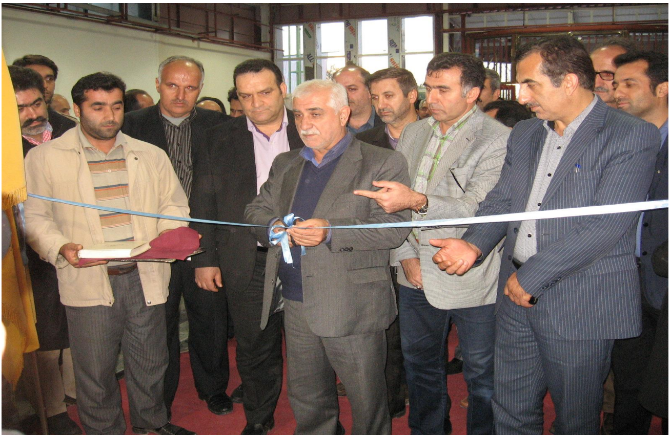
حضور در چهارمین نمایشگاه بین المللی نهاده های کشاورزی به میزبانی استان مازندران (۲)